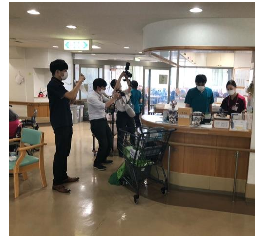
ナースステーション